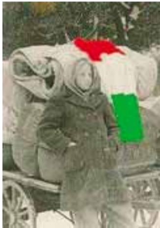
Giornata del ricordo per le vittime delle foibe

Celebrazione in ricordo delle vittime delle foibe e dell'esodo delle popolazioni italiane da Pola, Fiume e Zara, organizzata dall'Associazione nazionale Venezia Giulia e Dalmazia comitato di Bergamo in collaborazione con Comune e Provincia di Bergamo. Ore 15, al Parco delle Rimembranze della Rocca, posa di corone d'alloro al monumento dedicato alle vittime delle foibe, ore 16, Sala Simoncini di Palazzo Frizzoni, inaugurazione della mostra «Un popolo in esilio». Ore 17, sala consiliare di Palazzo Frizzoni, lectio magistralis «Un popolo in esilio» tenuta dallo scrittore, giornalista e docente universitario Stefano Zecchi.