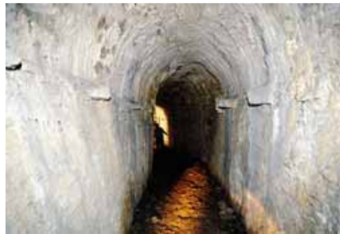
Apertura al pubblico delle cannoniere di San Michele