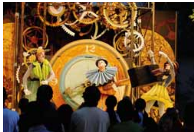
Costa di Mezzate: magie al borgo

Ore 20,45, chiesa parrocchiale della Malpensata, concerto musicale eseguito dall'«Ensemble Lumen» di Parigi.