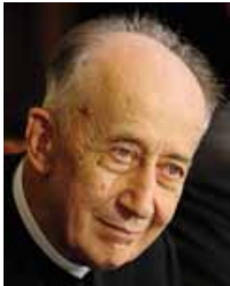
Il card. Camillo Ruini al Centro congressi

Ore 20,45, Istituto Locatelli, via Carducci 1, presentazione con l'intervento dell'autore, del libro fotografico di Annibale Battaglia «Ali bergamasche», dedicato alla Caproni e al campo di addestramento al volo di Ponte-Brembate. Interverranno Maurizio Pagliano, Giancarlo Milani, Enzo Buffa e Vanni Scacco. Presentano