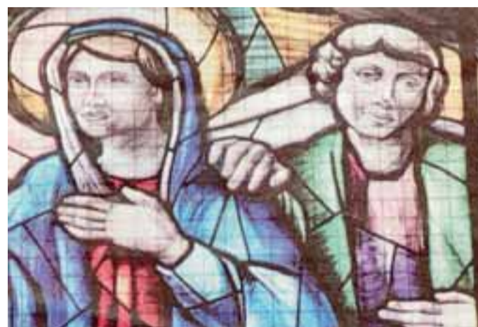
Seriata, personale di Emilio Belotti. Nella foto, una vetrata

Biblioteca, via S. Carlo 32, mostra «Valle Brembana e Valle Imagna - Arte, natura, creatività nel paesaggio bergamasco», organizzata dal Gruppo artistico Fara Stabile di Poesia di Bergamo, aperta fino a domani. Orari 16-18.