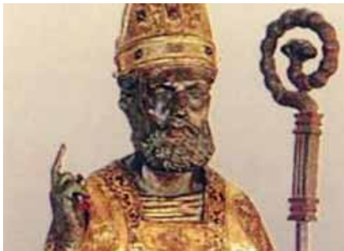
Gandino, Museo della Basilica: la collezione di sculture lignee

Ex Casa Zinetti, via Roma, mostra collettiva «ArtisticaMente... uniti», aperta fino al 25 aprile. Orari: oggi 17-20; domani 9-12, lunedì 9-12.