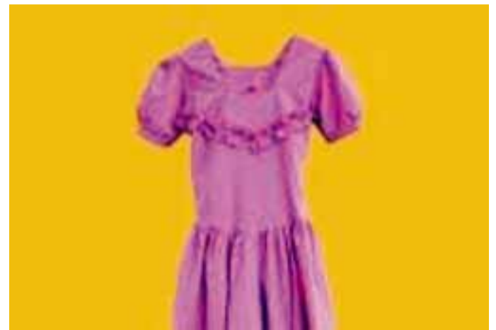
Galleria Mazzoleni, Benedetta Alfieri: «Evidenti».

Galleria Fumagalli, via Paglia 28, mostra di Vito Acconci «Space of the body - opere 1969-1986» aperta fino al 30 aprile. Orari: da lunedì a sabato