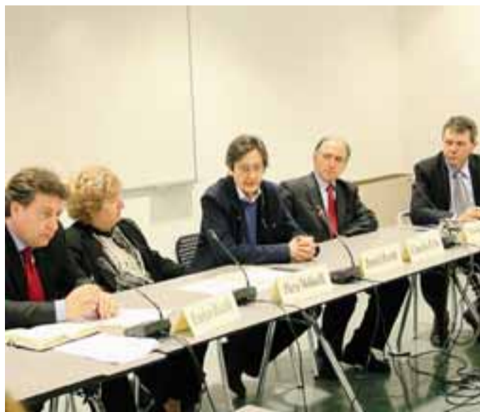
La presentazione del portale BgEuromondo in via Caniana