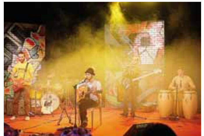
Polaresco, concerto della Piccola Orchestra Karasciò