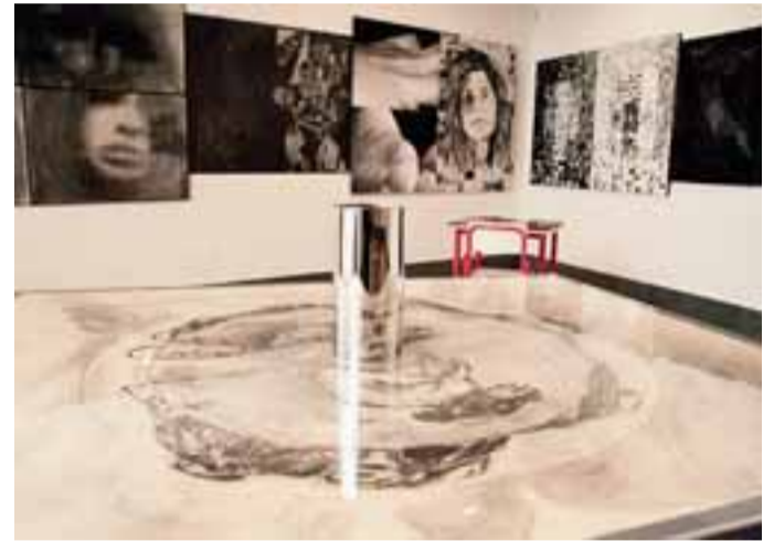
Gamec: «La classe non è acqua - Maestri contemporanei vs. giovani d'oggi»

Le opere vincitrici di concorsi internazionali di grafica