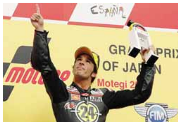
In via Zanica, cortile Securtec, aperitivo con il campione di Moto Gp Toni Elias

7/e, mostra «Il bianco e il nero - Impressioni acromatiche nell'arte moderna 1950-2000», aperta fino al 30 giugno. Orari: da martedì a sabato 9,30-12,30 e 16-19,30.