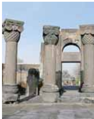
Nella foto a destra, il monastero di Geghard, scavato nella roccia. Nelle due foto sopra: il monastero di Noravank, situato in fondo a una gola rocciosa e i suggestivi resti della cattedrale di Zvartnots

ratteristiche cuspidi a ombrello le chiese e i monasteri armeni hanno ognuno una loro riconoscibile particolarità: spiccano gli edifici costruiti in posizioni particolari quali il monastero di Noravank - in fondo a una gola rocciosa - il monastero di Sagmosavank - sull'orlo di un canyon - o il bellissimo monastero di Geghard - in parte scavato nella roccia - o ancora i suggestivi re-