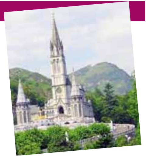
Il santuario di Lourdes

braio la Ovet di Bergamo organizza un pellegrinaggio con partenza in aereo da Orio al Serio. Il mattino, oltre al tempo a disposizione per la visita alla Grotta e per le confessioni, sarà impiegato per partecipare alla Via Crucis. Seguirà la celebrazione della Santa Messa e, dopo il pranzo AL ristorante, il pomeriggio sarà dedicato alla visita dei luoghi di Santa Bernadette con la possibilità di accedere alle piscine dei miracoli. Quota di partecipazione: 330 euro con sconti dal 20% all'80% per i bambini fino a 12 anni. Info: 035243723. ■